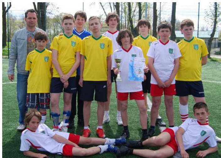
Drużyna ze Szkoły Podstawowej w Malanowie