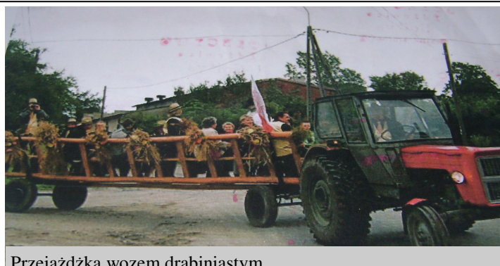
Przejażdżka wozem drabiniastym