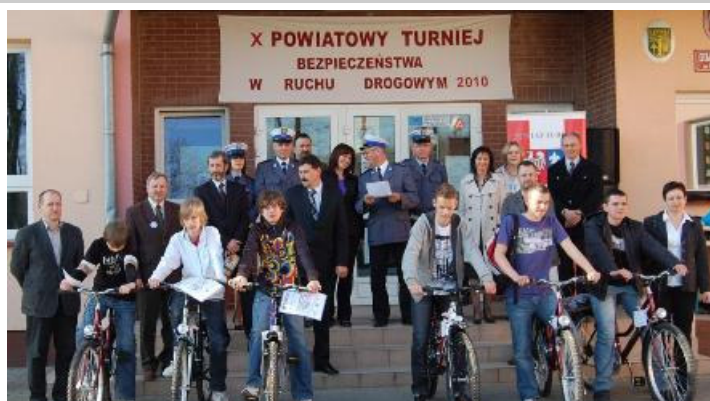
Zwycięcy z dumą prezentują otrzymane rowery