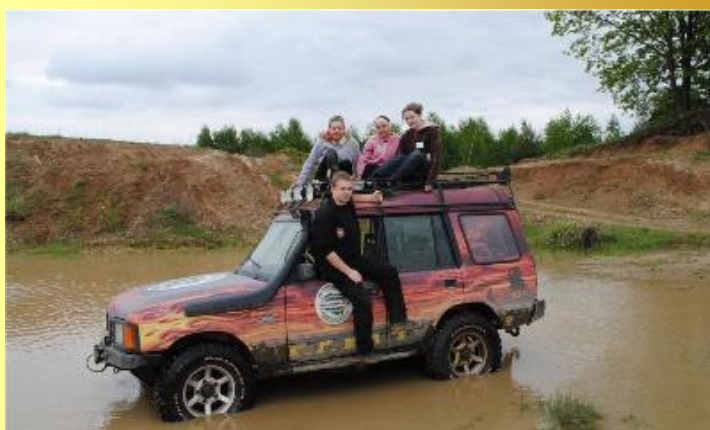
Przeprawa przez grząski teren