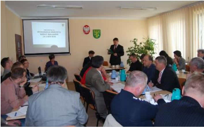
XXXVIII Sesja Rady Gminy w Malanowie

R adni Gminy Malanów przyjęli sprawozdanie Wójta z wykonania budżetu za rok 2009, jednogłośnie 15 głosami „za” udzielając absolutorium.