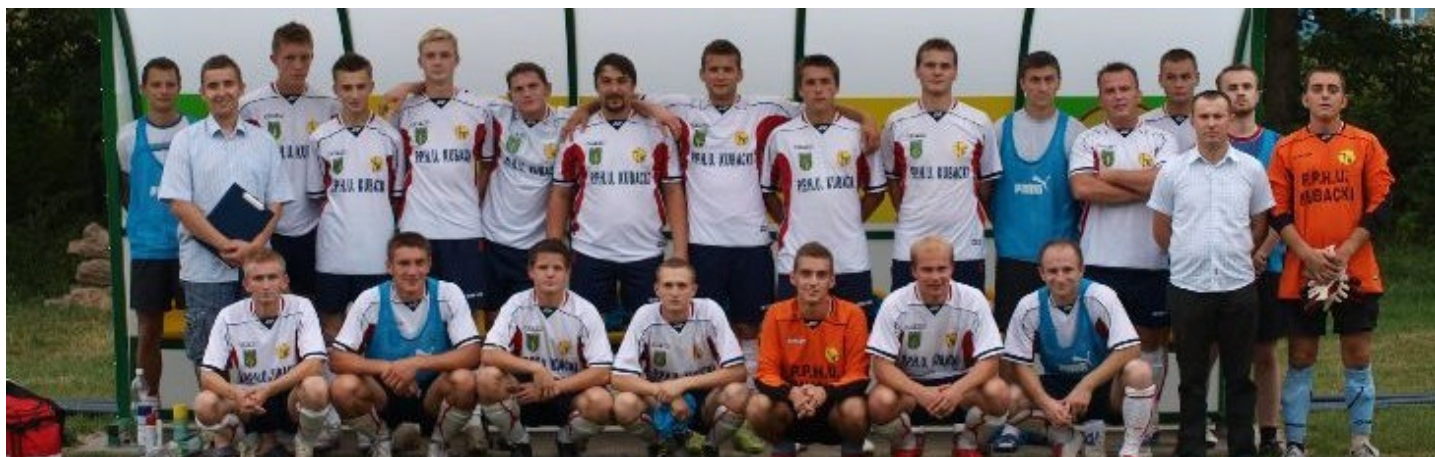
Drużyna GROM Malanów