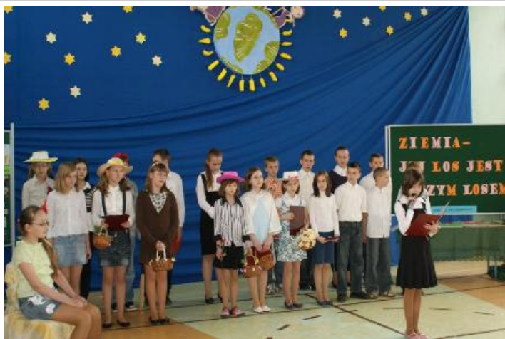
Apel z okazji Dnia Ziemi

Prosilili, aby Dzień Ziemi czczony był konkretną pracą dla niej, aby świętująca młodzież, zamiast „deptać i łamać co pod but wpadnie”, przysporzyła Ziemi zieleni, której coraz mniej, a nam samym do życia tak bardzo potrzebnej. Apelowali również do wszystkich – młodych i tych starszych o sadzenie drzew z różnych okazji: corocznych