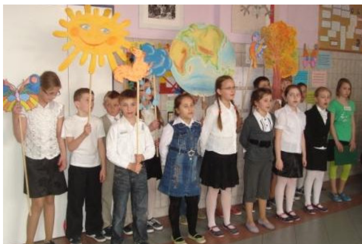
Apel poświęcony Ziemi

W konkursie plastycznym pt. „Szauuj las, póki czas!”